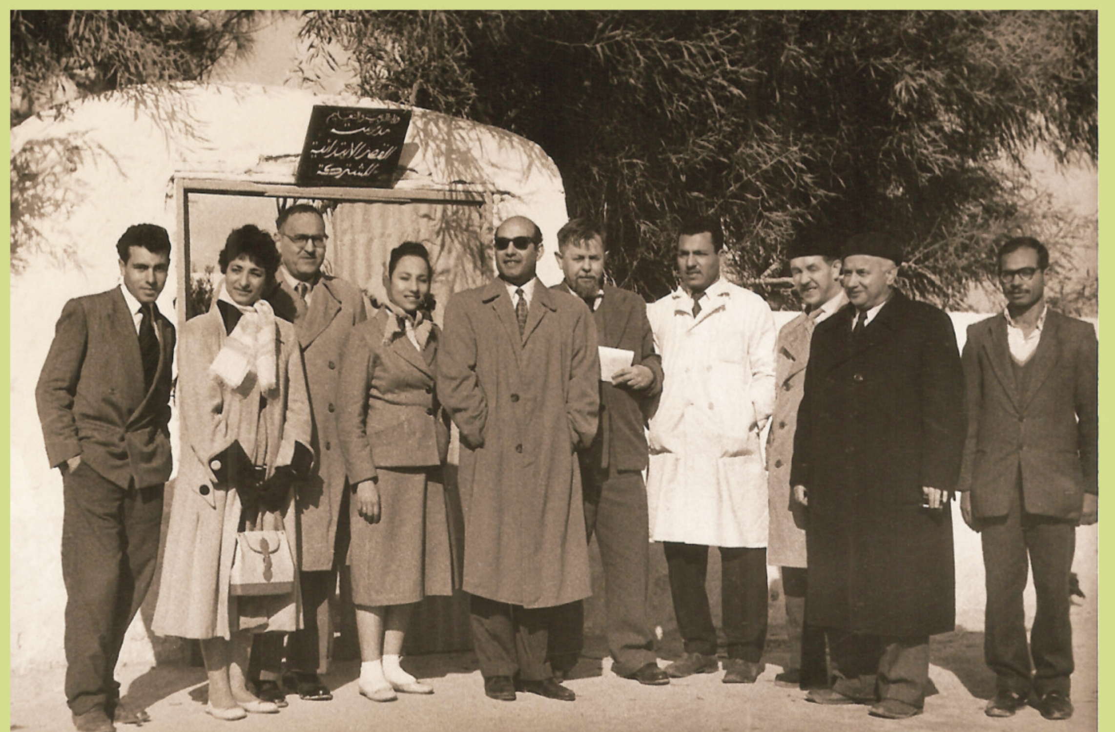
Wyprawa do Egiptu (1958)