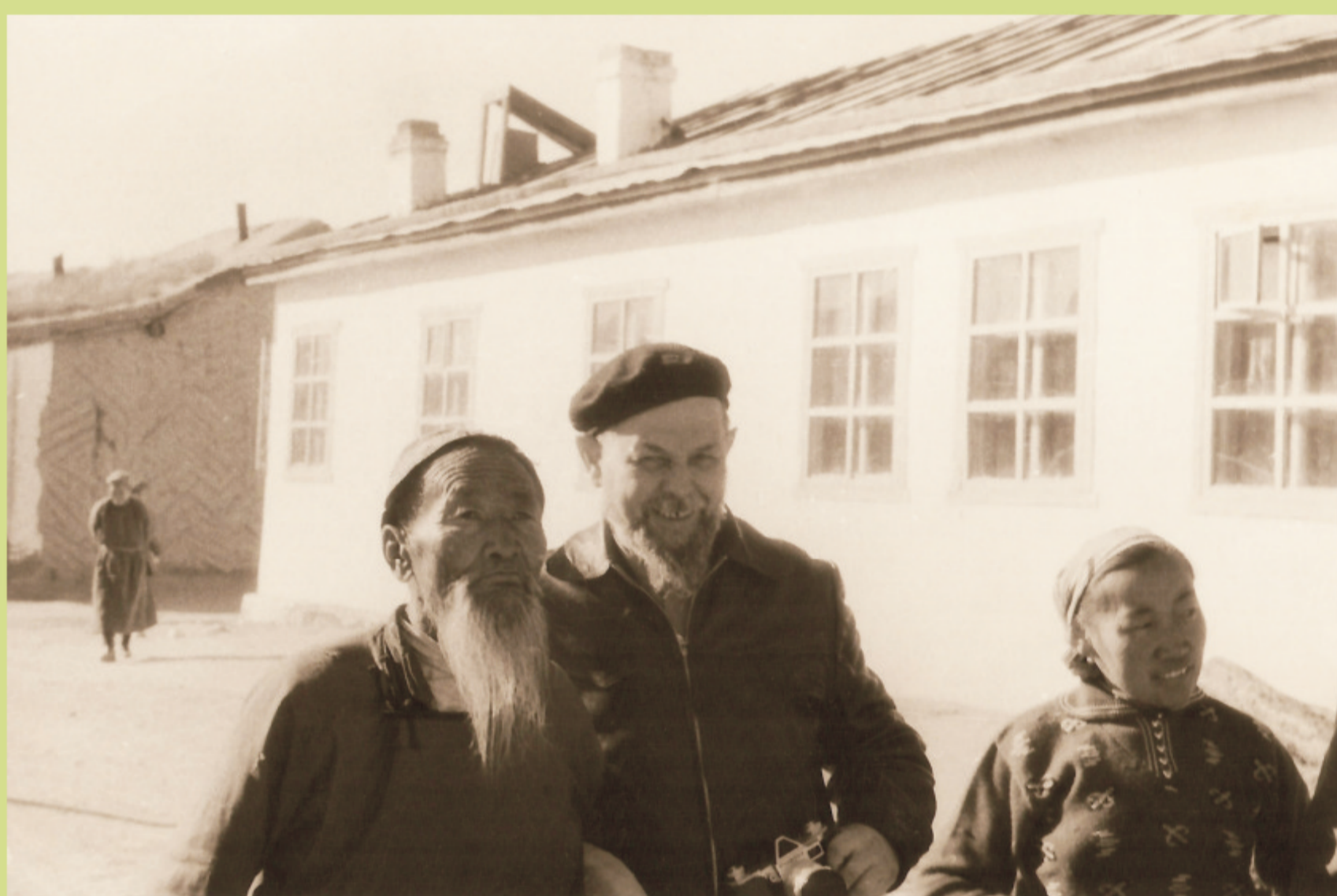
Łódzka Ekspedycja Antropologiczna do Mongolii (1959)